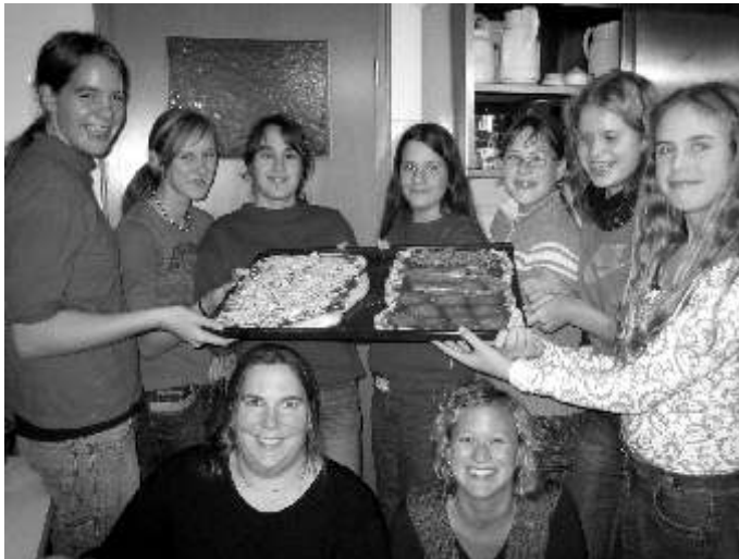
Bei einer Konfifreizeit vergangener Jahre

Mit dem Abendmahl werden wir uns auf unserem Wochenende mit unseren ungefähr 35 Konfirmandinnen und Konfirmanden aus dem Heilbronner Norden beschäftigen und dabei hoffentlich wie in den vergangenen Jahren viel Spaß haben: bei der Konfiolympiade am Freitagabend, dem Casinoabend am Samstag, bei der Nachtwanderung mit Lagerfeuer dem gemeinsamen Brotbacken und nicht zuletzt bei der Vorbereitung eines ganz besonderen Essens. Dazwischen bleibt genug Zeit zum Spielen und auch das Lernen kommt nicht zu kurz – das Abendmahl bietet viele Zugänge, der Bedeutung eines Sakraments auf die Spur kommen, das wir in unseren Gottesdiensten regelmäßig feiern. Am Ende werden wir auch in diesem Jahr ganz sicher wieder viel erlebt und wenig geschlafen haben.